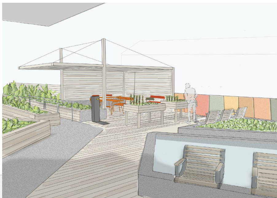
Le bassin, le potager surélevé et la pergola

L'espace ombragé créé par la pergola est l'occasion de faire une pause au frais et à proximité de la fontaine à boire . Enfin des brumisateurs bénéficiant aux deux zones complètent cette zone ombragée pour le jours les plus chauds.