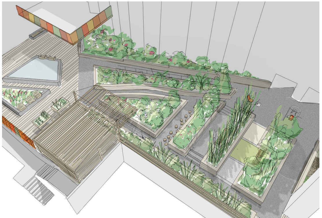
Les bacs de toucher

Enfin des bacs de toucher enrichissent les stimulations sensorielles du jardin.