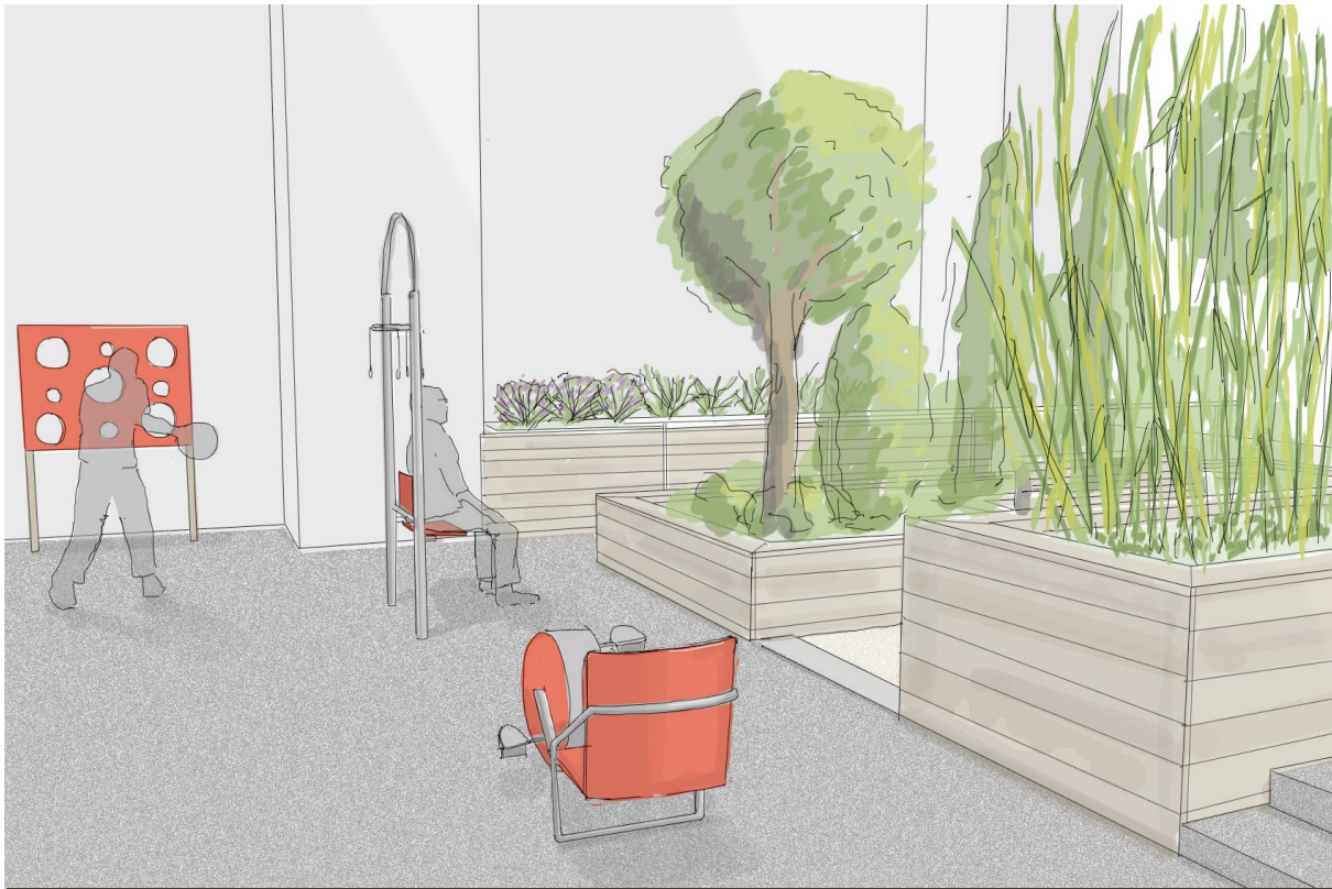
Les agrès et le panier de basket

Une zone équipée d'agrès comprend un pédalier, un métro et un panier de basket permet une mobilisation des membres inférieurs et supérieurs grâce à un matériel adapté.